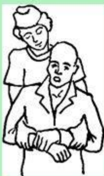
Рис. 2-11. Удерживание методом «захват через руку»

Правой кистью охватите спереди правое запястье вашего помощника - это запястный, или единичный захват , или охватите правой кистью друга в области правого запястья, располагая кисть на передней поверхности - это двойной запястный захват , или возьмите друг друга правой рукой, как при рукопожатии, - это захват рукой , или охватите правой рукой 1-4 пальцы друг друга - это захват пальцами .